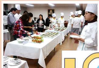
名古屋調理師専門学校 の生徒達による 新メニュー提案