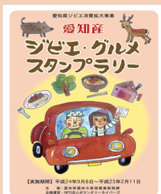
2012年9月8日~ 2013年2月11日 参加22店舗でジビエ料理を召し上げて頂く、スタンプを進呈。スタンプ3個で応募、2月11日足助交流館で抽選会。それまで参加可能です。