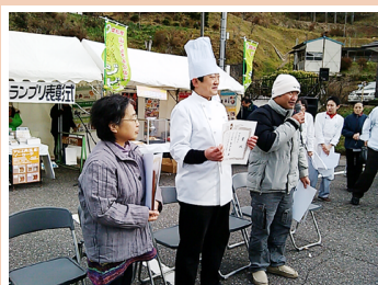
2012年12月8~9日 ジビエ・グルメ・グランプリ表彰式 (どんぐりの里いなぶ 豊田市)